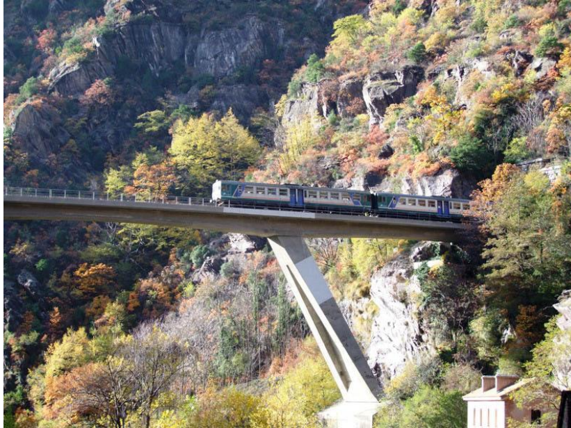
Ferrovia Cuneo Nizza