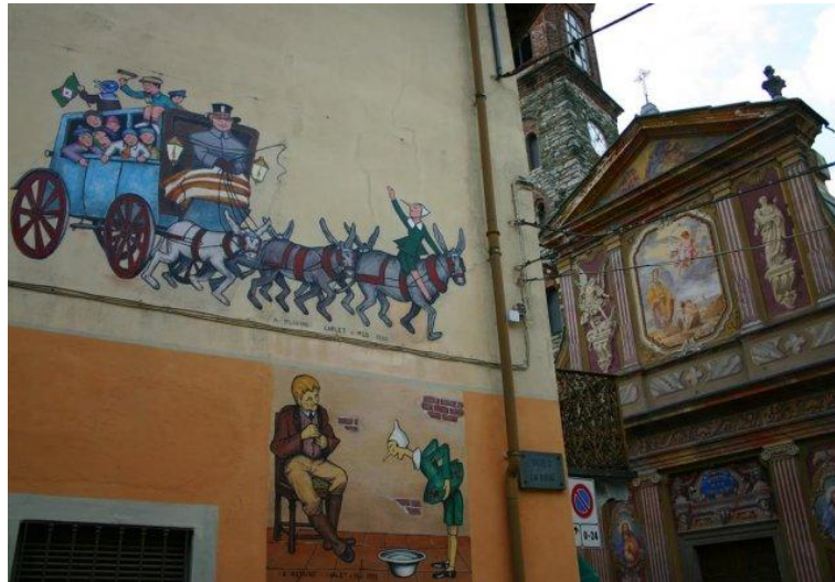
Murales a Vernante

La visita continua sus l'estatala, qu'arriba al Vernant. Sus lhi murs d'las maisons a pauc près 90 murales son dedicats a la vicenda de Pinocchio: per longtemp es estat resident al Vernant Attilio Mussino, istòric illustrator de la fabla de Collodi. Lo musèu Attilio Mussino se tròba enti locals de l'ex Confrairia e recuelh de taulas originalas de l'artista realizaas per l'edicion Bemporad dal 1911, en part reproduchas sus lhi murales. En via Umberto I d'istat es dubèrt lo centre vísitas dal Parc de las Alps Marítimas, embe un'exposicion dedicaa al bòsc de faus de Palanfrè e al trabalh a l'alp. Amont dal país se dreïça la Torosèla, çò que resta dal chastèl di Lascaris, bastit ental sècle XIII per controlar lo passatge per lo còl de Tenda.