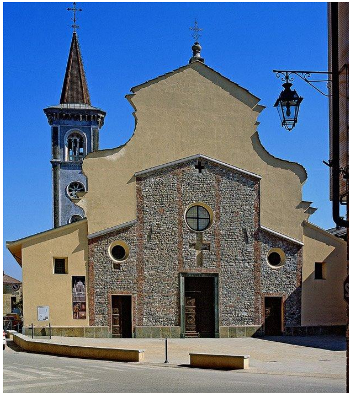
Borgo San Dalmazzo

A l'extrèm Sud-Est de l'àrea lingüística occitana, la Val Vermenanha es tèrra de confin en tuchi lhi sens: da la França la divid lo còl de Tenda, que separa las Alps Líguas da las Marítimas. Lo lòng dal crinal demoron las sevèras testimonianças de las òbras defensivas bastias entre lo sècle XIX e la II a guèrra mondiala, qu'an jamai agut lo batesme dal fuec. E puei lo crinal alpin marca lo confin entre dui ambients, aquel alpin e aquel mediterrani de la vesina Provença.