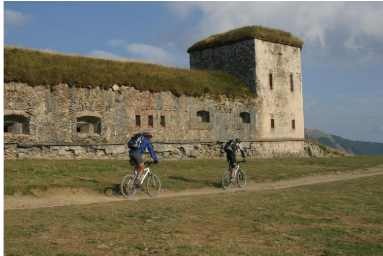
Forti al Colle di Tenda

Pus amont la via SS20 arriba a Limon, istòrica estacion d'esquí alpin de las premieras en Itàlia (1907), ai pè de la poncha Mirauda (2157 m) e de la Ròca de l'Abís (2755 m). Lo país, qu'encuei a un aspèct modèrn per lhi tanti insediaments torístics, es atestat dal sècle X, quora patiet de ravatges da part di sarrasins. Lo centre istòric garda la parroquiala de Sant Peire en Víncol, bastia en estil gòtic ental 1363. Da Limon la SS20 contínua vèrs lo tunèl dal còl de Tenda mas derant de lhi arribar una deviacion mena a Limonet: la ruua es un di accès al comprensòri d'esquí de Limon, mas es interessant da visitar bèla d'istat per la ret de percors excursionístics de “Lo Viasol”, sèt viòls pro de bèl far. Da Limonet un d'aquesti percors torna percòrrer lo traçat roman dal chamin per lo còl de Tenda.